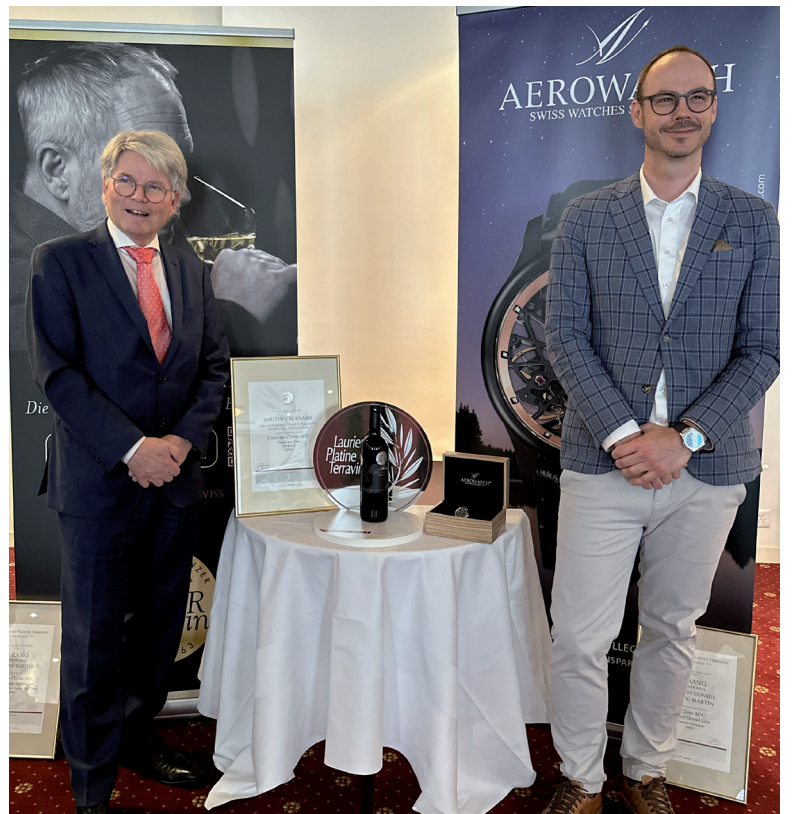
Verleihung Spezialpreise durch Aerowatch