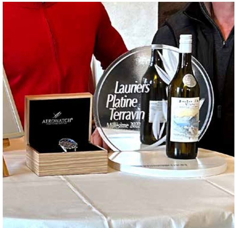
Der von Aerowatch gestiftete Sonderpreis

Union Vinicole de Cully, Lavaux AOC Villette, Butterblume, 2022